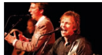
Simon & Garfunkel „Feelin Groovy“ Open Air, Fr. 20. Juli Schlosshof Weinheim

13:00 Uhr BASF Tennisclub Herren - TC BW Oberweier Ludwigshafen BASF Tennisclub