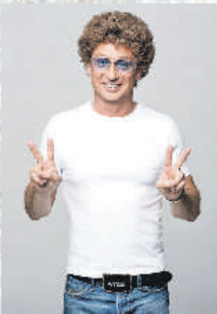
Atze Schröder am 18.04.2015 in der SAP Arena Mannheim