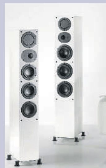
SCHLANK, klar, klassische Farben: So lauten die aktuellen Trends für die Inneneinrichtung im Wohnzimmer - bis hin zu den darauf abgestimmten Lautsprechern.

Auf jeden Fall, der pure Musikgenuss rückt wieder stärker in den Mittelpunkt. Ein interessanter Trend, der dabei zu beobachten ist, führt wieder zurück zum klassischen, ehrlichen Stereo-Genuss. Weniger ist mehr, diese Erkenntnis setzt sich immer stärker durch und führt weg von einfachen Mehrkanalanlagen hin zu Stereo-Lautsprechern - die dann aber eine Top-Qualität aufweisen sollen. Das gilt übrigens nicht nur für das Musikhören, sondern auch für den Spielfilmabend. Schließlich ist das moderne Wohnzimmer die Schaltzentrale für alle Medien und das gesamte Home Entertainment. Wer sich für neue Lautsprecher interessiert, sollte also zuvor genau seine Erwartungen kennen - und zudem die Boxen passend zum Raum, zum Grundriss und der Raumgröße auswählen.