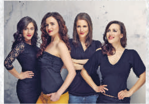
„Les Brünettes“ am 19.04.2015 im Capitol Mannheim