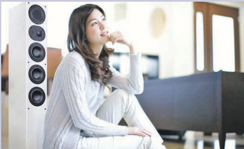
Das moderne Wohnzimmer wird immer mehr zur Multimediazentrale. Ein gutes Lautsprechersystem gehört für den Musik- und Filmgenuss dazu - schön, wenn sich die Boxen auch mit ihrem Design harmonisch in den Raum einfügen.

Ein weiterer Trend für ein modernes Wohnzimmer: Die Technik macht alles möglich, soll aber zugleich in Optik und Design unauffällig und chic daher kommen. Das beste Beispiel dafür ist das Audio-System. Wo früher dominante Lautsprecher-Batterien aufgebaut wurden, will man HEUTE echten HiFi-Klang genießen, der aber nicht nur gut klingt, sondern auch gut aussieht. Was im Trend liegt und worauf es bei der Planung ankommt, erläutert Klangexperte Günther Nubert.