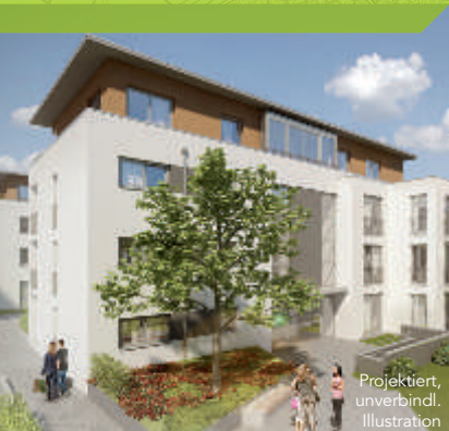
Projektiert, unverbindl. Illustration

AWO Die AWO Rhein-Neckar bietet den Bewohnern unserer Wohnanlage die Möglichkeit zur selbständigen Haushalts- und Lebensführung und zur bedarfsgerechten individuellen Versorgung. Zu festen Zeiten und nach Vereinbarung wird eine qualifizierte Betreuungskraft vor Ort sein. Weitere Informationen: www.awo-rhein-neckar.de oder Tel. 06201 4853-0