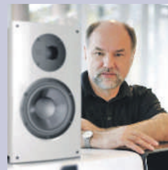
Der Klangexperte Günther Nubert beschäftigt sich seit fast 40 Jahren mit dem guten, echten Klang.