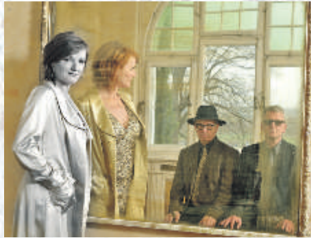
„Nina Petri“ am 26.03.2015 im Capitol Mannheim